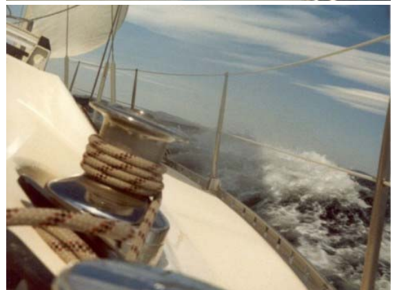
.... und nässer! Typisches Mistralgewölk, wir verziehen uns nach Cavalaire sur mer - und warten ab.