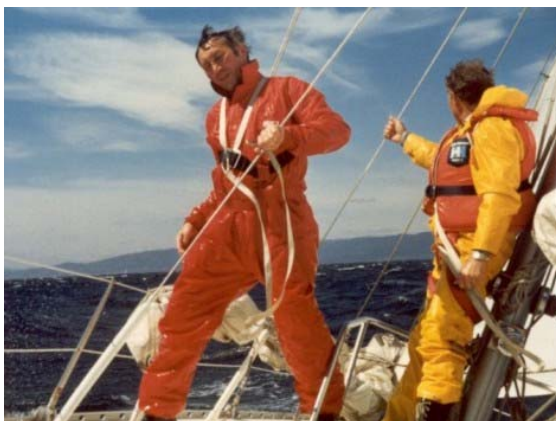
Es wird nass ....