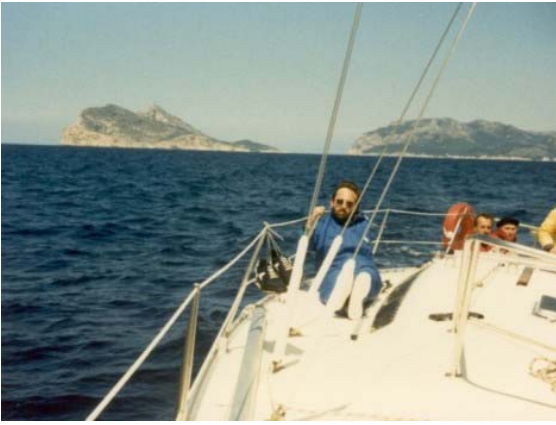
Ein schöner Törn zwischen Mallorca und Dragoneira hindurch nach Ibiza