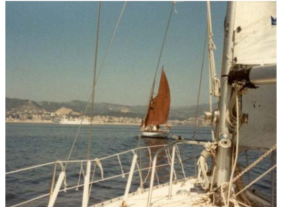
Wir nähern uns unserem Ziel, Palma de Mallorca