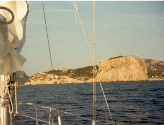
An StB der Einfahrt zum Hafen von Andraitx liegt dieser mächtige Brocken.