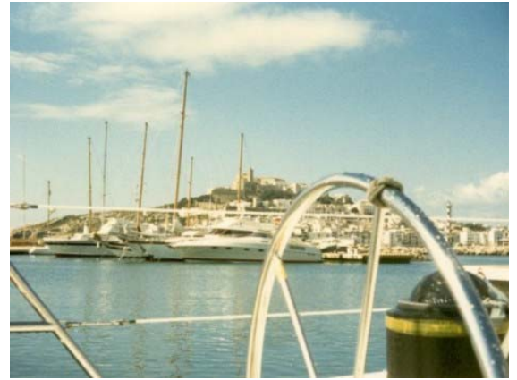
Ibiza Die Insel haben wir mit zwei Kleinwagen erkundet