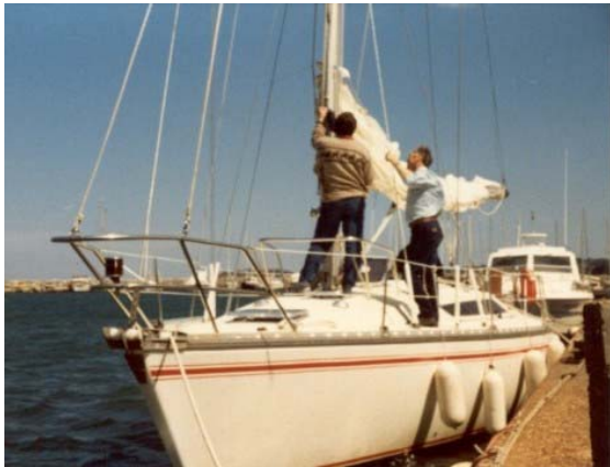
Wir übernehmen die „SILVERSHADOW“ in der Marina de Gogolin