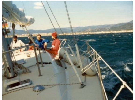
Schon kurz nach Auslaufen (nur unter Fock) erwischt uns der Mistral